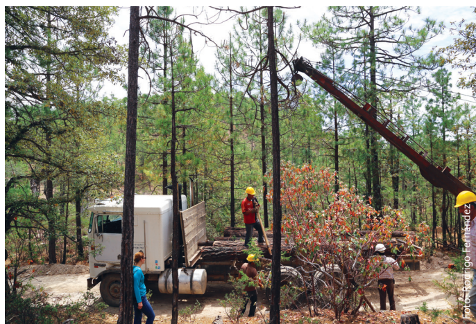
El manejo forestal sustentable es un ejemplo de acción REDD+, ya que aumenta directamente la captura de carbono en los bosques.

El análisis bibliográfico de experiencias y mecanismos de distribución de beneficios reconoce una multiplicidad de elementos a ser considerados para el diseño de un mecanismo de distribución de beneficios para REDD+. Para simplificar su análisis, éstos han sido agrupados en tres categorías: elementos conceptuales, elementos estructurales y elementos de implementación. Esta sección analiza cada una de estas categorías y su aplicación bajo el contexto mexicano. La definición de estos elementos debe integrar una serie de principios para la distribución de beneficios que han sido definidos internacionalmente y que se describen en este apartado.