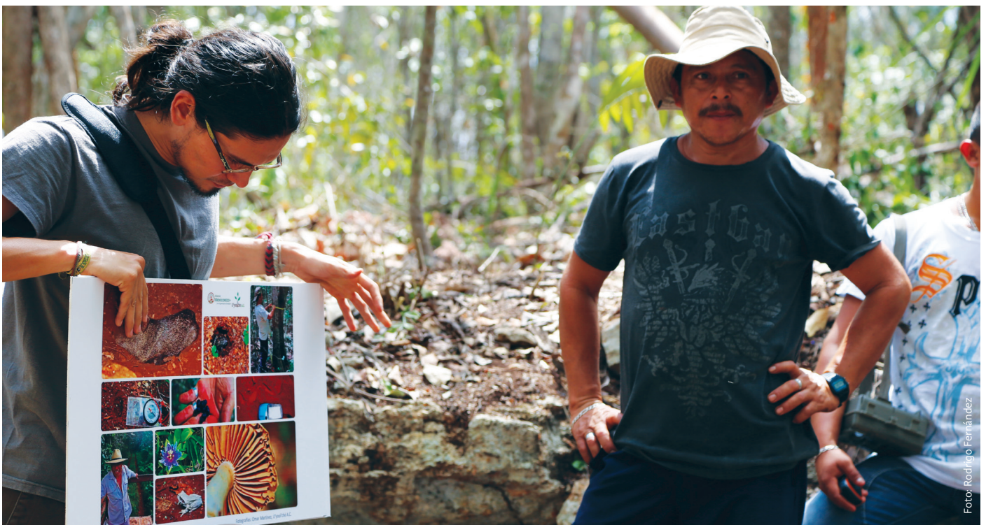
La conservación de la biodiversidad se considera un beneficio colateral (co-beneficio) de las acciones REDD+. Los co-beneficios agregan valor a las iniciativas REDD+.

Por último, dentro de los elementos conceptuales hay que definir los costos que serán considerados para calcular los beneficios a distribuir. Se distinguen tres tipos de costos: costos de oportunidad , costos de implementación y costos de transacción . Los costos de oportunidad se refieren a la pérdida de ingresos causada por las acciones o actividades de REDD+. Los costos de implementación incluyen los costos incurridos para desarrollar y realizar las actividades y acciones REDD+. Los costos de transacción comprenden los costos monitoreo, medición, reporte y verificación del carbono y del cobro y distribución de los beneficios derivados del mismo. Para distribuir beneficios, también hay que distinguir quien incurre en los costos –la federación, las instituciones implementadoras o los actores locales.